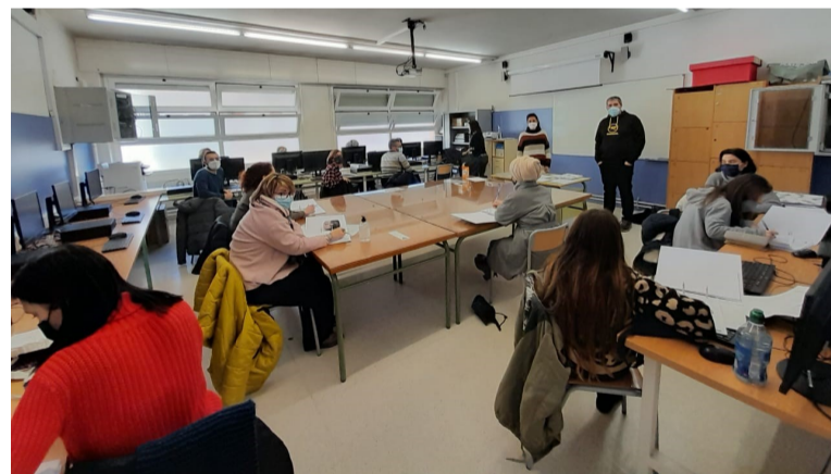
El SEFED realitza la seva formació al INS Antoni Pous

és possible gràcies al Centre de Formació en Serveis a la Comunitat.